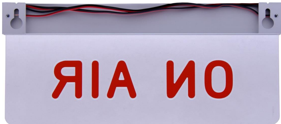
Рисунок 2.2 – Табло, вид сзади