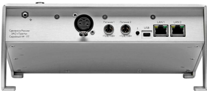
Рисунок 2.3 - Блок TP-808. задняя панель

Внешний вид задней панели блока TP-808 показан на рисунке 2.3.