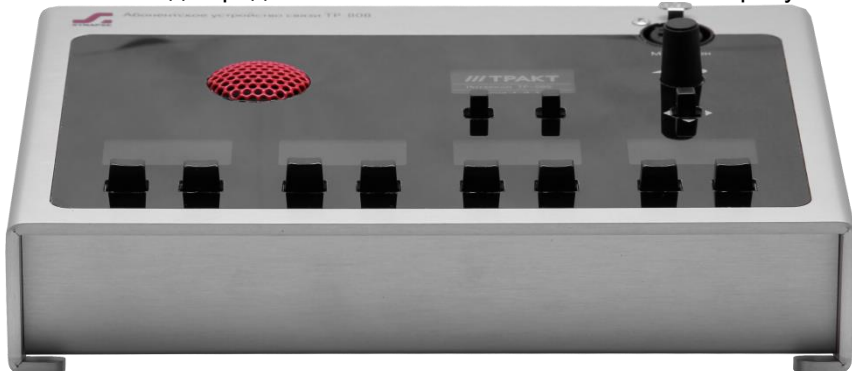
Рисунок 2.2 - Блок TP-808. передняя панель

Внешний вид передней панели блока TP-808 показан на рисунке 2.2.