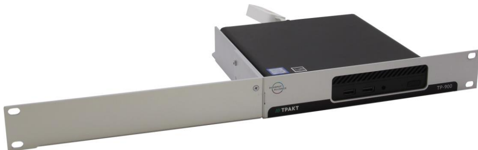
Рисунок 3.1 - Монтаж KP-900