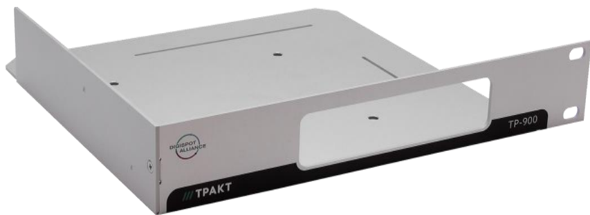
Рисунок 2.1 – Внешний вид KP-900

Для установки в стойку корпус KP-900 соединяется с любым блоком компании Тракт в 1/2 RU корпусе.